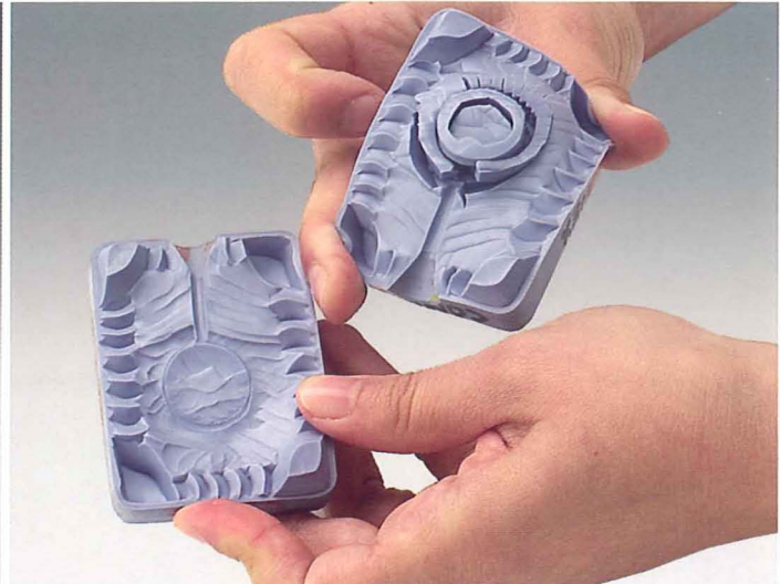
Facilidad de corte y estabilidad dimensional.