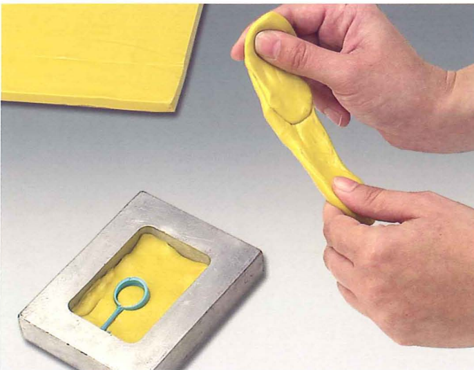
Fácil moldeo y mayor rapidez.