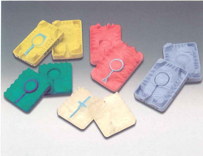
Varias calidades para todo tipo de aplicaciones.